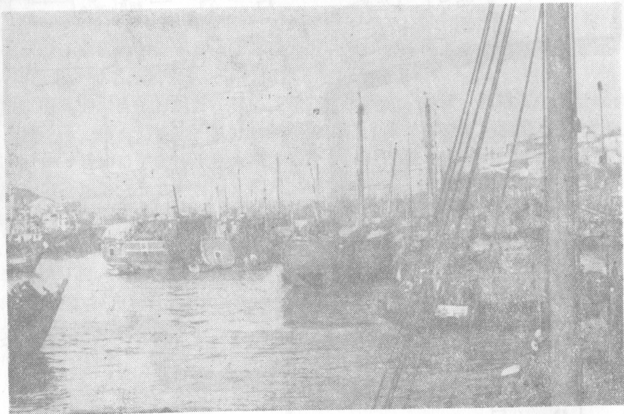
新建公社外海渔业队

新建公社居民聚居于雀嘴村，全村面积约1平方公里，辖9个大队、3个场(淡水养殖场、农场、海带养殖场)、4个企业单位(渔机厂、拉丝厂等)。